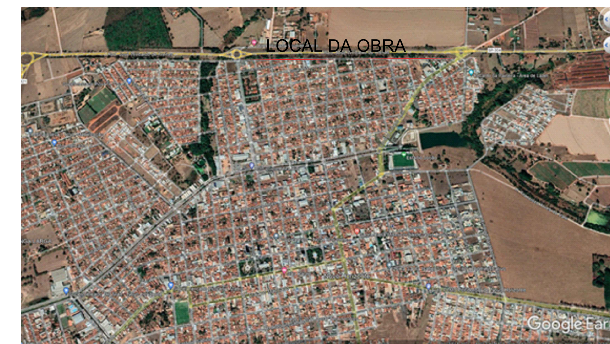
GOOGLE EARTH SEM ESCALA